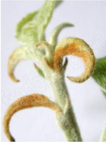
Symptômes sur Pommier