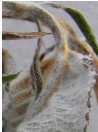
Symptôme sur Pommier