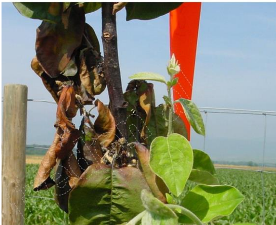
Symptôme sur Cognassier

Le code rural et de la pêche maritime, art. L201-7 à L201-11, rend obligatoire tout signalement de la présence de cet organisme à la DRAAF Grand Est - SRAL site de Strasbourg ou à la FREDON Alsace.