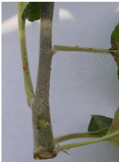
Symptômes sur Pommier