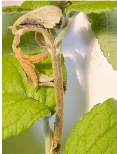
Symptômes sur Pommier