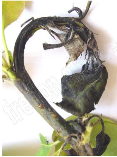
Symptômes sur Poirier