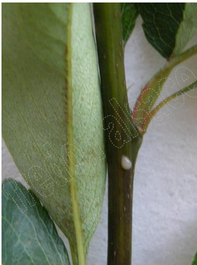
Symptômes sur Poirier