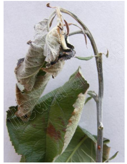
Symptôme sur Pommier