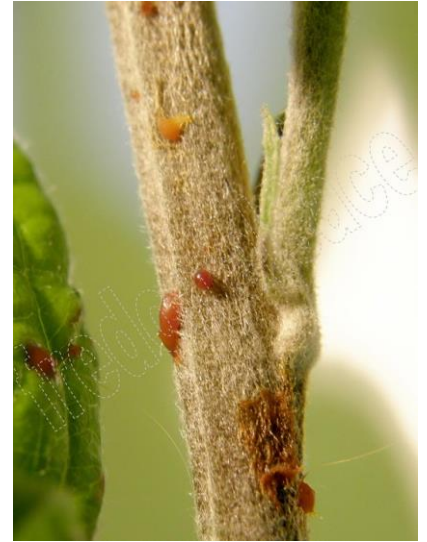
Symptômes sur Pommier

Symptômes sur rameaux en forme de crosse, présence ou absence d'exsudat. En cas d'absence d'exsudat : confusion possible avec des dégâts de Cèphe (insecte piqueur suceur).