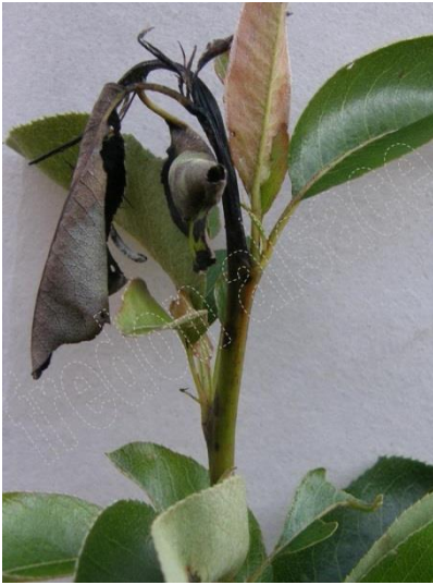
Symptômes sur Poirier