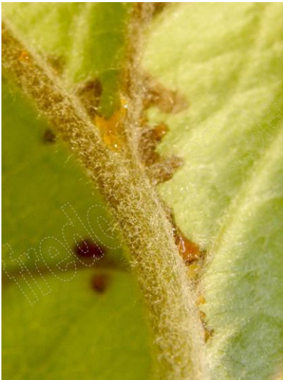
Symptômes sur Pommier

Symptômes sur rameaux en forme de crosse, présence ou absence d'exsudat. En cas d'absence d'exsudat : confusion possible avec des dégâts de Cèphe (insecte piqueur suceur).