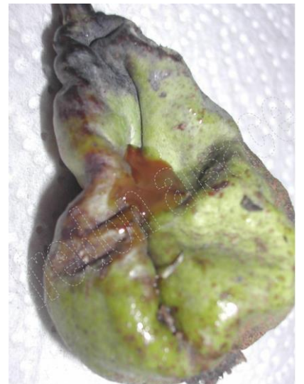
Symptômes sur Poirier