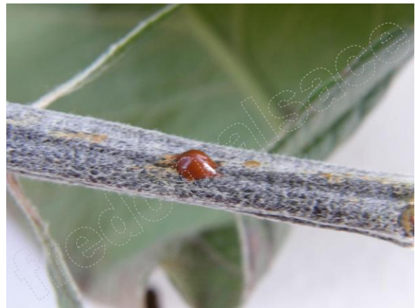
Symptôme sur Pommier